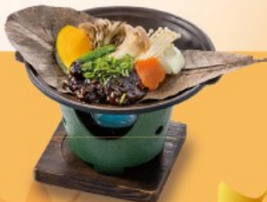
きのこ朴葉焼き 【単品】580円