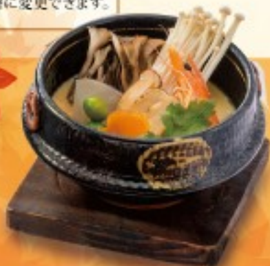
秋の姫蒸し 【単品】580円